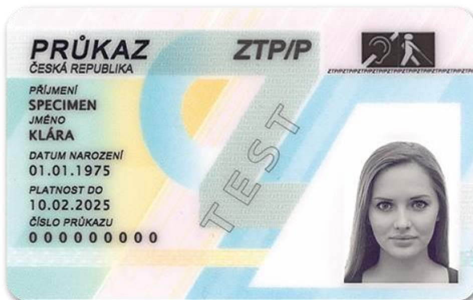
Obr. 3 – Průkaz ZTP